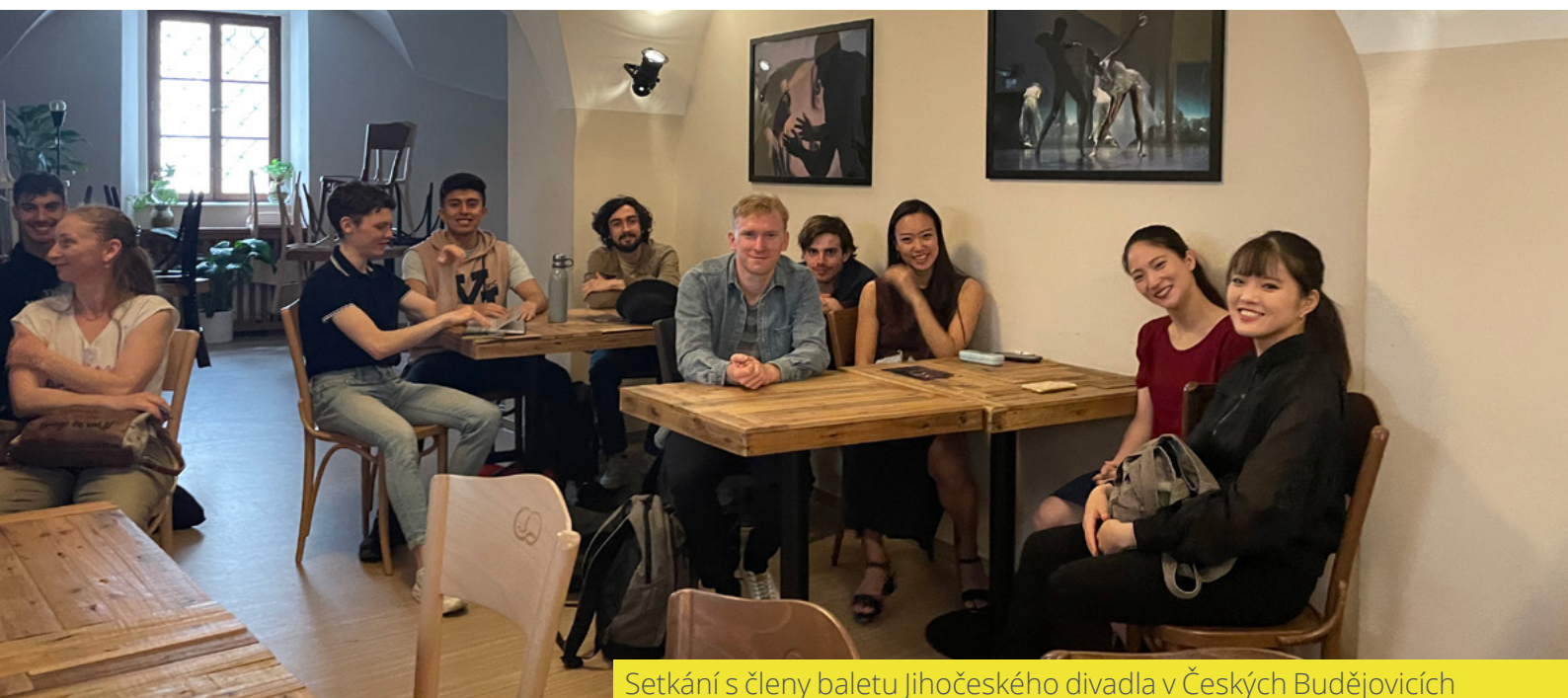
Setkání s členy baletu Jihočeského divadla v Českých Budějovicích

Opět se potvrdilo, že osobní setkání jsou velmi efektivní a napomáhají k budování důvěry a dobrých vztahů.