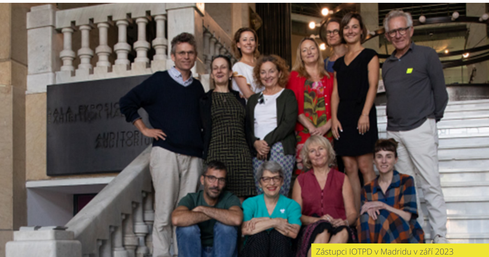
Zástupci IOTPD v Madridu v září 2023

Setkání v Madridu bylo nesmírně intenzivní – jednotliví členové prezentovali činnost svých organizací, plánoval se up-date webových stránek, diskutovala se změna podmínek pro udělování Philippe Braunschweig grantu, který mohou dostat tanečníci či tanečnice, kteří/které nedosáhnou na podporu druhé kariéry ve svých zemích. Dále se plánovalo setkání k oslavě 30. výročí založení IOTPD a předběžně byl přijat návrh a pozvání do Londýna na podzim 2024, kdy organizace Dancers' Career Development slaví 50. výročí založení. Byla by to tedy příležitost oslavit obě významná výročí současně.