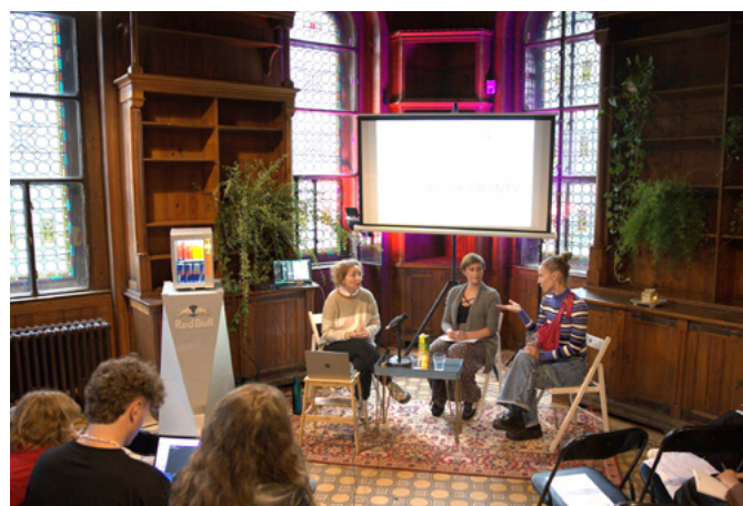
Seminář pro komunitu street dance tanečnicků a tanečnic na festivalu Trhejparket

Zcela novou oblastí, s níž navázal Nadační fond pro taneční kariéru kontakt poprvé, je oblast pouličních a klubových tanců – krátce řečeno street dance. Členové této silné a početné komunity fungují většinou jako OSVČ nebo jako malé podnikatelské subjekty – školy, produkční či kreativní jednotky. Organizátoři zcela nového třídenního festivalu Tancesraz nás požádali o vhled do dotační problematiky, neboť řada projektů, které se na této scéně odehrávají, je zcela nekomerční a má povahu kulturní služby. Festival měl kromě komunitního programu a prezentací i další rozšiřující program zaměřený na vzdělávání a prohlubování znalostí v rámci streetové komunity. Seminář se odehrál 22. 9. 2023 v knihovně Gabriel Loci.